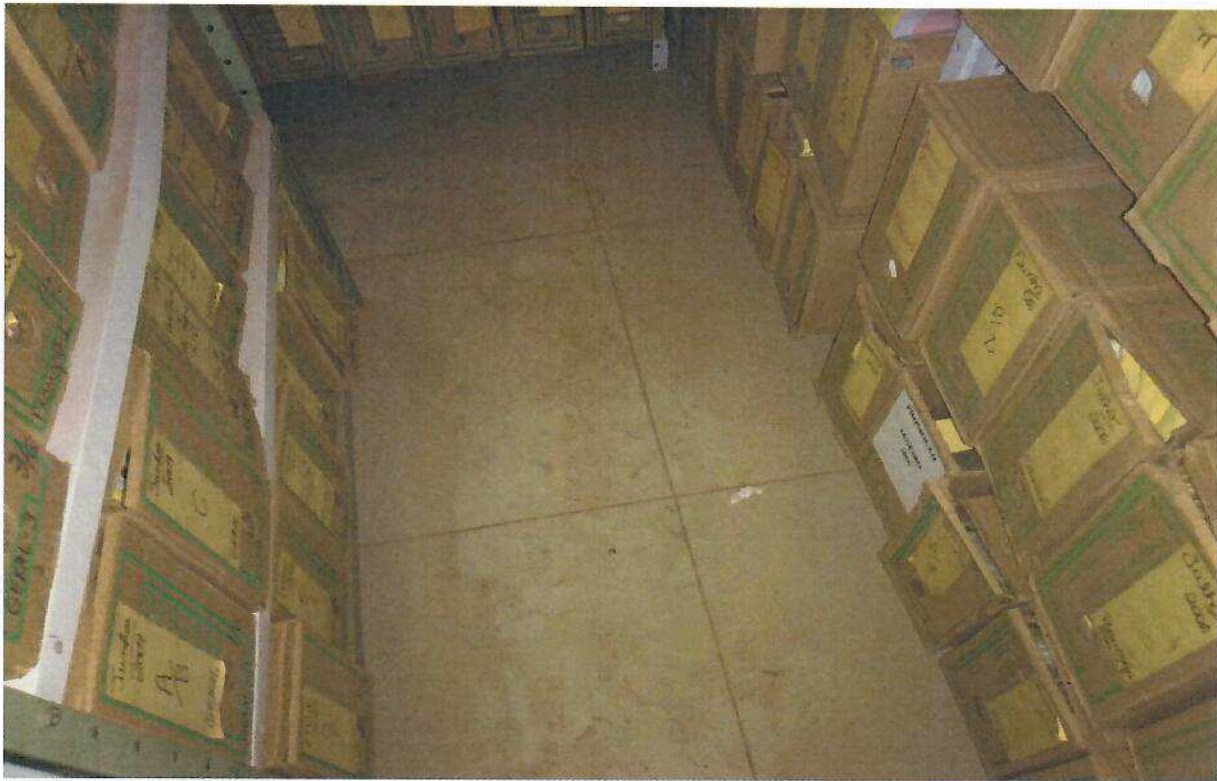
DEPOIS DA LIMPEZA